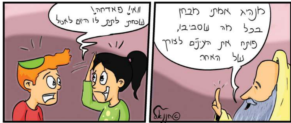
ילדים, אילו רעשים ייחודיים ניתן לשמוע במהלך הישיבה בסוכה?